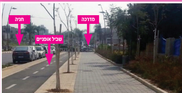
(*התמונה לצורך המחשה בלבד)

קטעים 6 ו-7 (שדרות הגליל והשפלה): העבודות יכללו מצע חדש, תאורה, קווי ביוב, שביל אופניים ברחוב השפלה וריצוף מדרכות. העבודות ישפיעו על הסדרי התנועה, פינוי הפסולת, מקומות החנייה ועוד בתקופת הביצוע. בימים אלה מתכננים את תהליך העבודה - במקטעי כביש או חצי כביש בכל פעם, נעדן בחלופה שנבחרה.