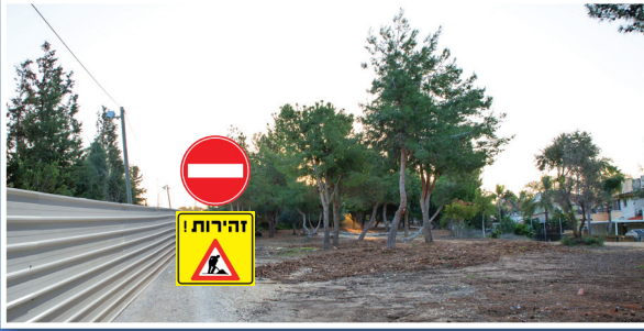
(*התמונה לצורך המחשה בלבד)

קטע שלישי (החורשה/העיקול): סלילת כביש במקביל לרחוב בית קשת והחורשה. לאורך קו העבודות תוצב גדר בטיחות בגובה 2 מטרים ולא תתאפשר כניסת תושבים לחורשה (אופי החורשה ישמר ויתוסף שביל הליכה מוסדר).