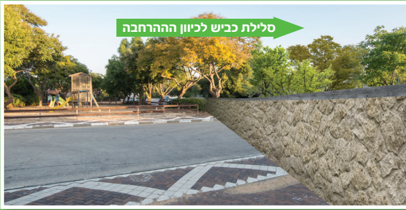
(*הדיוקן בתמונה לצורך המחשה בלבד)

קטע רביעי (המזרחי): סלילת כביש במקביל לרחובות בית קשת - בית זית וכן בניית קיר תמך בגבהים משתנים 1.5-3.5 מטרים, בהתאם לתנאי השטח של הציר ההיקפי. קיר התמך יחצה את סוף רח' בית קשת (באזור הכביש ללא מוצא), בהמשך יישק לחומת הבית ברח' בית זית 53 ויסתיים לפני העיקול בשד' הגליל. לאורך קו העבודות תוצב גדר בטיחות בגובה 2 מטרים. הגישה הרגלית לקצה הרחוב תשמר ותוסט מעט. לאורך התוואי תהיה רצועת שטח ציבורי ירוקה ושבילים משולבים.