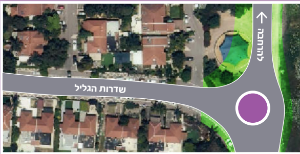
(*התמונה לצורך המחשה בלבד)

קטע 5 (הכיכר): הכיכר תיבנה בעיקול שדרות הגליל ותתחבר לכביש המוביל לשטח ההרחבה. לצורך העבודות יבוטל גן השעשועים הקיים ועם סיום העבודות יוקם בסמוך גן שעשועים חדש. יבוטלו מספר חניות ציבוריות והסדרי התנועה יבוצעו בהתאם להנחיות מהנדס התנועה.