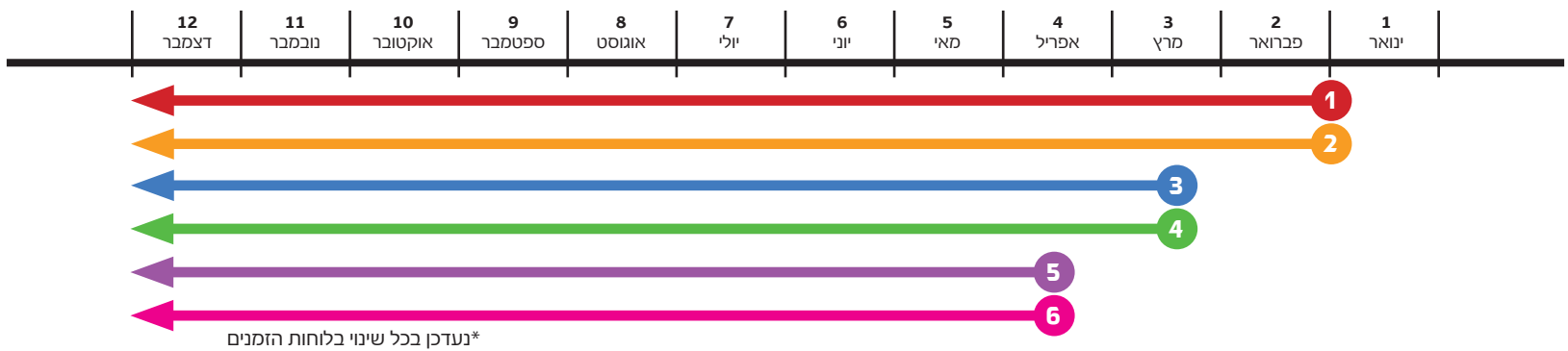
(*היקף בתמונה לצורך המחשה בלבד)